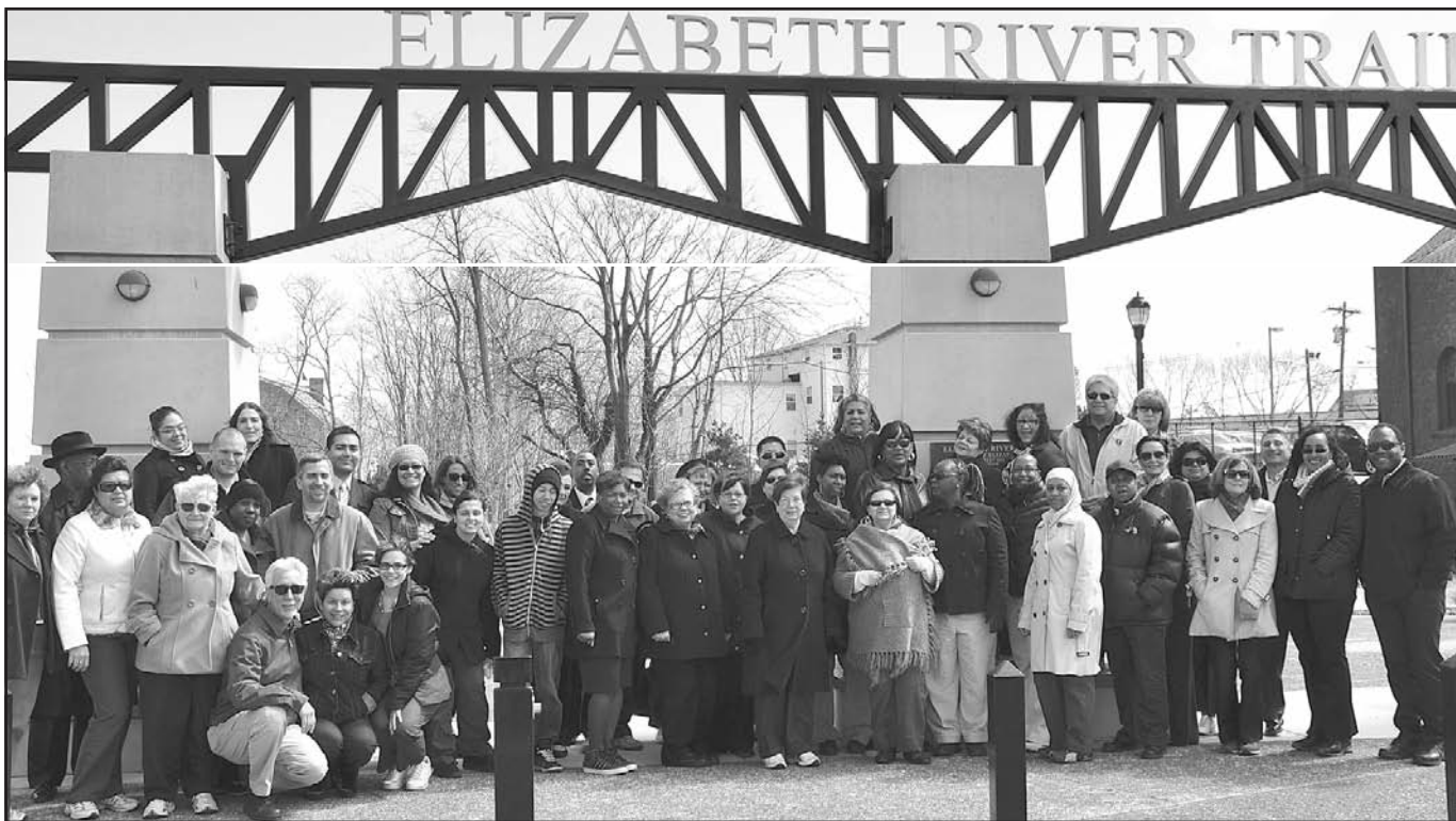
Grupo de empleados municipales de Elizabeth a su paso por el “River Trail”, durante la caminata.

Para conocer más sobre los proyectos y programas en torno a la salud corazón se recomienda visitar el sitio electrónico www.heart.org